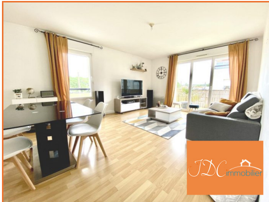
Appartement à vendre Le Mans (72)

Référence JLA21762, Mandat N°4064 À deux pas du centre ville, venez visiter ce charmant appartement T3 lumineux de 67 m 2 .