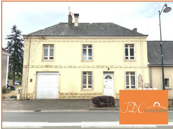
Maison à vendre Louplande Vendu