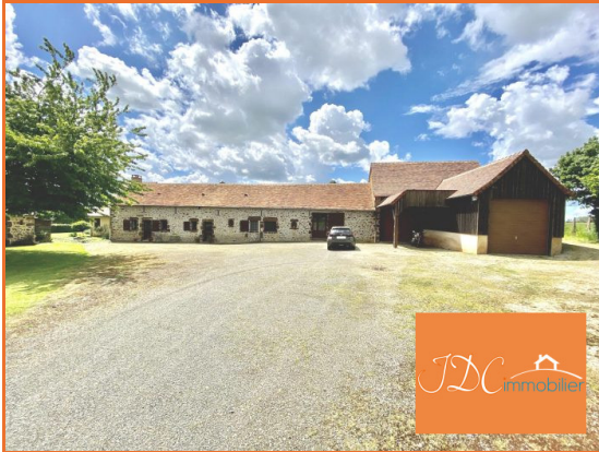
Maison / Longère à vendre Louplande (72)

Référence JLM21891, Mandat N°4061 Sur la commune de Louplande à seulement 15 km du Mans.